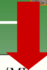
Émissions de CO, NO 2 et SO 2 lors de la combustion (mg/MJ)